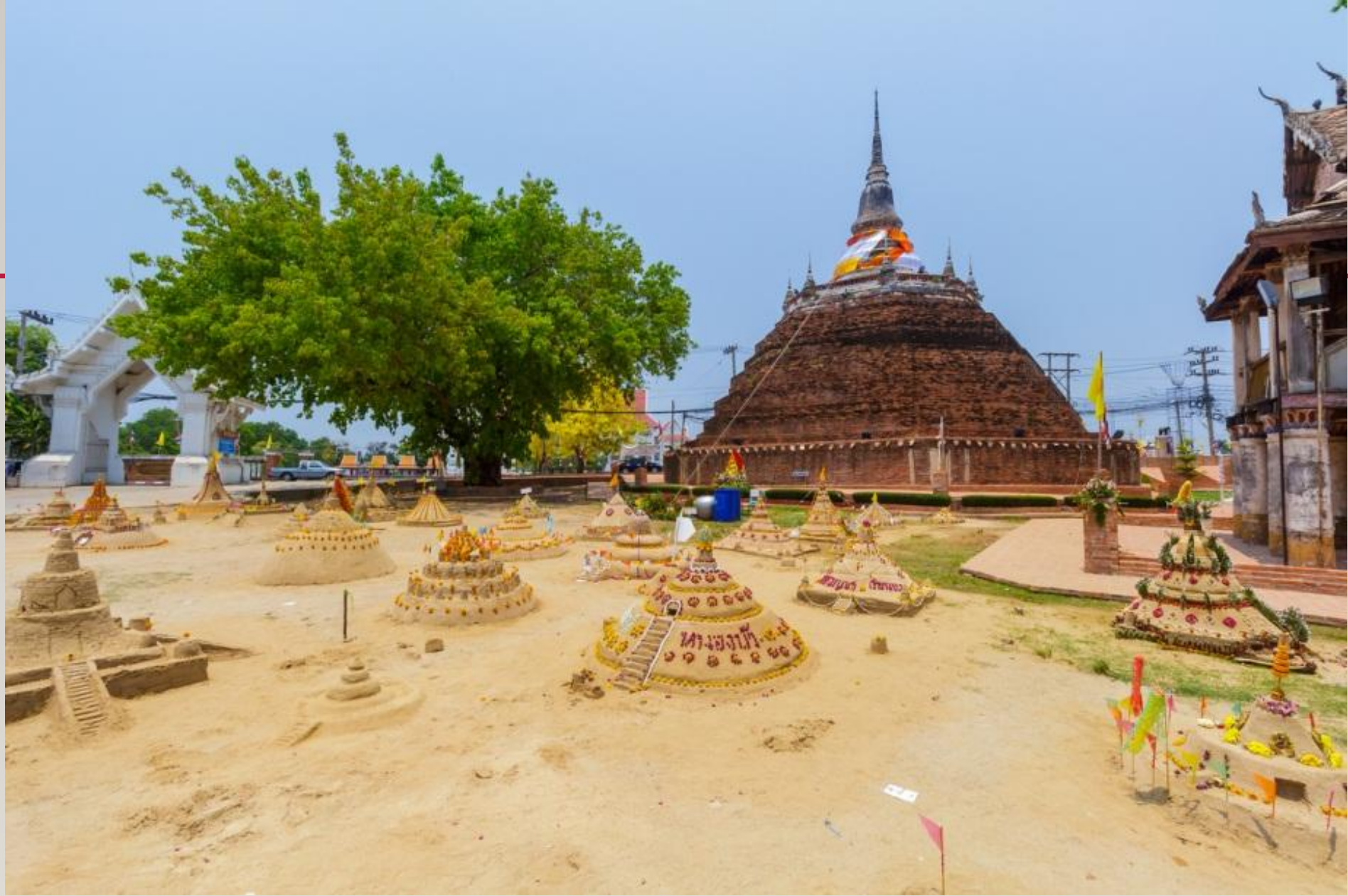
Carrying sand to temple and forming sand pagodas, as well as bathing rite for Buddha images and the monks